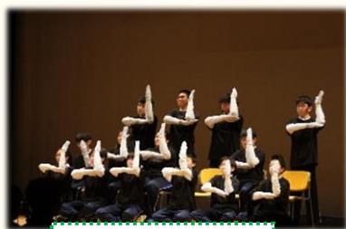
タッピングダンス