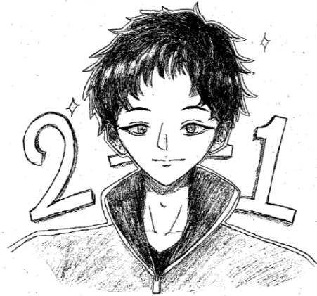
かみごもり だいせんせい 上籠 大先生

私たちのクラスは、真剣に授業を取り組んだり、ふざける時は全力でふざける、とてもメリハリのあつた楽しいクラスです。9月の体育祭では、学年種目の綱引きで1位を取り団結力を深めました。英語の授業では、最初に歌う曲で立ち上がりながら歌う人もいて、クラス1人1人がとても愉快で個性がありクラスの皆を笑わせて盛り上げてくれます。また、けがをしているクラスメイトに対して、荷物を持ったロッカーにあるものを取ってきたりと、とても優しく、思いやりがあります。そして、この大変な世の中での学校生活において、色々なことが制限されていても、その中で遊べる遊びを作ったり、話をしたりしてクラスの中でも楽しくできるように工夫をしています。2年1組は、とても明るく優しくメリハリのある最高のクラスです！