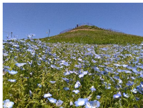
ネモフィラの丘。学校近くの川和富士にて。

六月にある体育祭では、1年生から3年生まで力を合わせ、ひたむきに 頑張る姿が見られることを今から楽しみにしています。