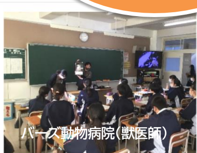
バーク動物病院(獣医師)