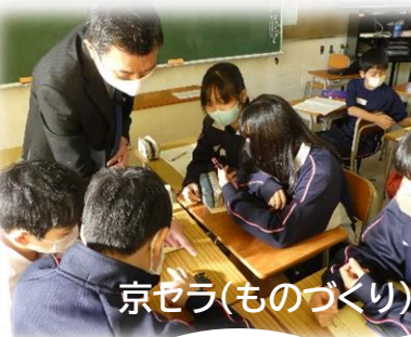
京セラ(ものづくり)