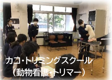
カコ・トリミングスクール (動物看護・トリマー)