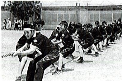
3年生学年種目 とびつき綱とり