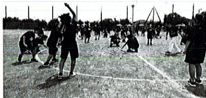
2年生学年種目 綱引き