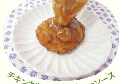
チキンカツ バーベキューソース