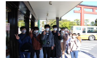
昼食場所の近くで、『おなかすいた〜！』