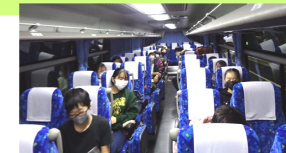
3クラス・バス6台に分乗して出発！！