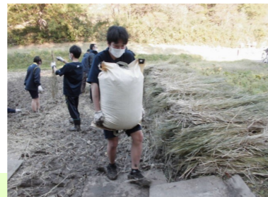
収穫されたお米はずっしり重みがありました。