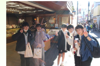
小町通りでお土産を購入。