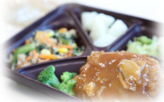
中学校給食メニューの例 (チキンカツ・デミグラスソース、ツナと小松菜のソテー など)