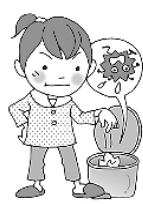
使ったティッシュはすぐに捨てる