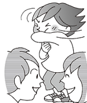
まわりの人にかからないように横を向く