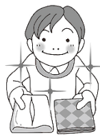
ティッシュ・ハンカチを持っておく