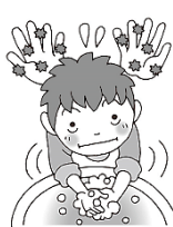
手で覆ったときは、手を洗う