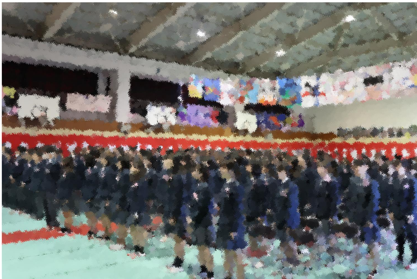
卒業生合唱の様子①