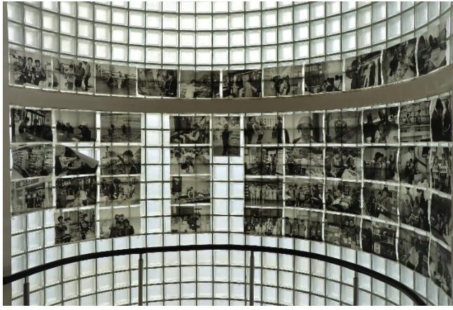
1階から3階までの廊下に、1・2年次の写真を掲示しました。