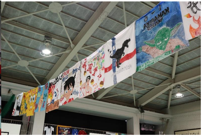
会場の様子①（在校生のクラス集合写真を掲示しました） 会場の様子②（1年次2年次のクラス旗を掲示しました）