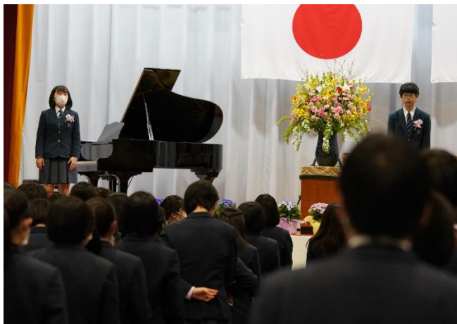
卒業生合唱の様子②（「旅立ちの日に」）