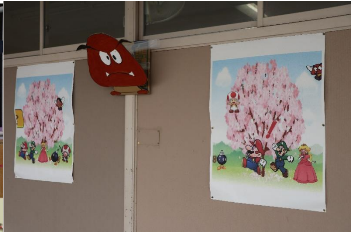
会場の様子④（各部のユニフォーム・部旗などを掲示しました）3年生のフロアに、お別れ会で使う予定だったキャラクターを並べました。