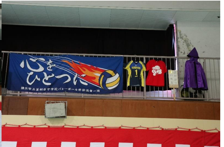
会場の様子③（各部のユニフォーム・部旗などを掲示しました）