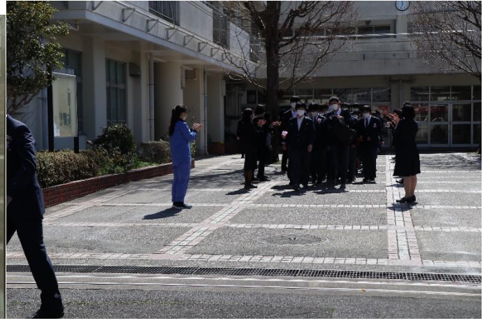
最後の学活を終えて・・・