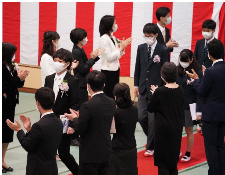
卒業生入場の様子