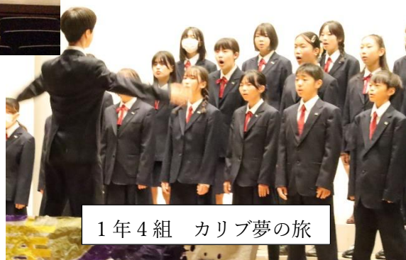
1年4組 カリブ夢の旅