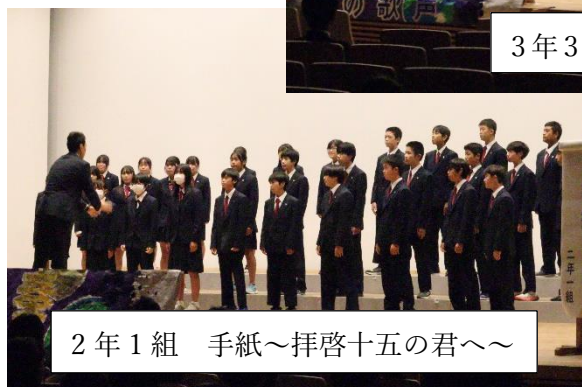
2年1組 手紙～拝啓十五の君へ～