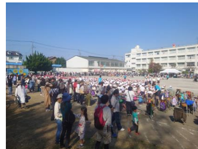
左から、さちが丘小学校・南本宿小学校・万騎が原小学校