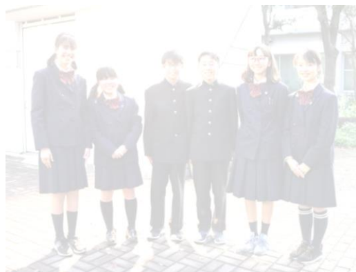
平成 31 年度 新生徒会本部役員のみなさん

30 年度の本部役員は現役員としてこのまま 3 月まで活動し、31 年度の新役員は 12 月から現役員とともに活動します。12 月から 3 月までは 10 人で活動します。