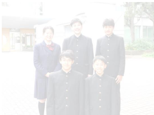
平成 30 年度 現生徒会本部役員のみなさん