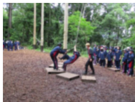
PAA ロープにつかまって移動