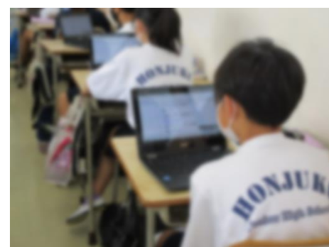
英語 デジタル教科書で学習