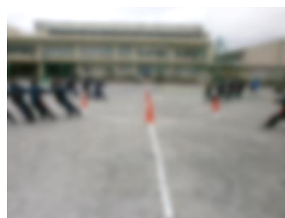
▲4方向から一斉に引きます

3年生の学年種目も2年生と同じく綱引きですが、なんと“4方向から引く”という今まで見たことのない競技です。綱の先には旗が置かれていて、その旗を早くとったクラスの勝利となります。本宿中で初めて行われる競技であるため、練習の段階から試行錯誤している様子が見られました。これまでは3年の学年種目といえば騎馬戦が定番でしたが、コロナ禍においてはリスクが高いために種目の変更となりました。