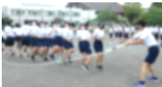
▲2年生の大縄練習の様子