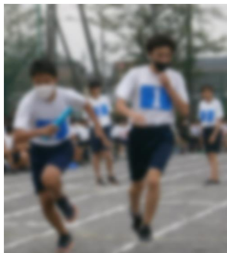
▲全員リレーのバトンパス

学年種目のとりを飾ったのは3年生でした。文字通り“クラス全員”でバトンをつなぐリレーです。作戦がカギを握る競技だけに、事前の作戦立ても重要だったようです。白熱の激戦を制したのは3年1組でした。