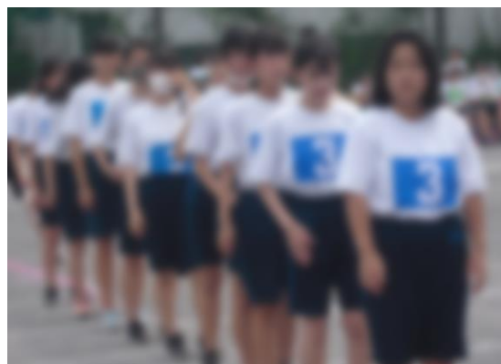
▲190回はお見事でした!