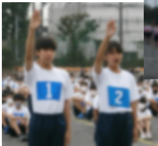
▲開会式での選手宣誓

コロナウィルスの影響で様々な学校行事が中止になる中、短縮プログラムではありましたがどうにか開催することができました。例年は夏休み前から練習を始め、8月下旬の2学期から本格的になります、今年度は8月中旬より学校が猛暑の中始まり、体育の授業も水泳ができず、体育館やグラウンドでおこないました。暑さに慣れながら練習を行ったつもりでしたが、体育大会前や当日に体調不良や怪我をしてしまう生徒がいたことは反省しています。保護者の方々や、地域の方々に頑張る姿を見せることができなかったのが残念ではありますが、生徒たちは今年度も、大縄跳びをはじめ全種目に一生懸命取り組むことができました。また、準備や体育大会の運営、片付けなども協力しスムーズに行うことができ、生徒達は友達と共に何かを成し遂げる楽しさや達成感をしっかりと感じ取ったことと思います。来年は保護者の方々の前で、元気な姿を見せられることを願います。