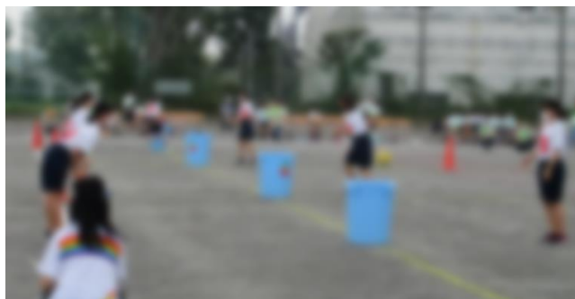
▲1年生のホールインワンの様子

昨年度から始まった競技で、サッカーボールやハンドボールをバケツの中に順番に入れていきます。