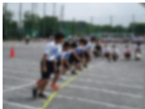
男子トラック走のスタート

9月17日(木)、第41回体育大会を本校のグラウンドで行いました。今回は感染症拡大予防の対策から、地域の方や保護者の方をお招きすることはできず、生徒の応援席の間隔を広くとるなど、通常とは異なる体育大会になりました。天候にも恵まれ、それほど気温も上がらず、熱中症の心配をあまりしないで済みました。生徒たちは「熱盛(あつもり)」のスローガンのもと、大声の応援はできなかったものの、全力で競技に取り組む姿勢で体育大会を大いに盛り上げていました。今年度、全校生徒が参加して行う初めての行事が、無事終わりました。