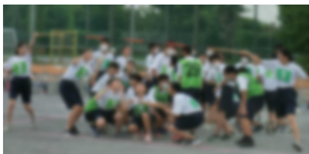
▲棒が頭上を通過する2年生の学年種目

2年生の学年種目は、1本の棒を4人で持ち、速さを競う競技です。回転時に呼吸を合わせることや、棒をジャンプしてまたぐ箇所が勝負の分かれ目になりました。回転しながら疾走する様子は、さながら“台風”でした。優勝は2年3組でした。