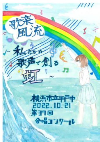
〔一年五組 岡村 美咲〕