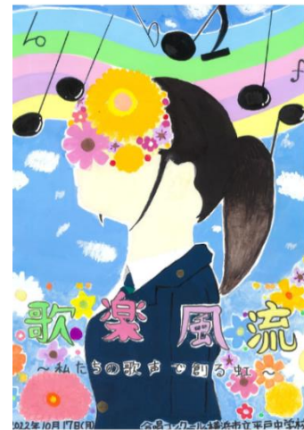
〔三年六組 伊地知 みなみ〕