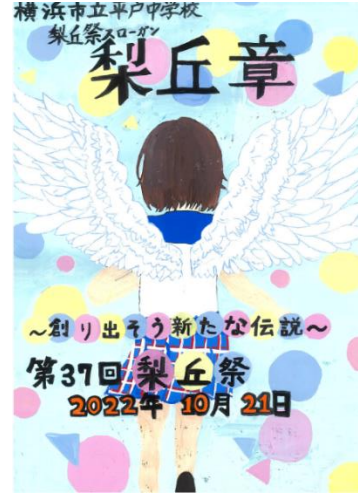
〔一年四組 平澤 音羽〕