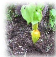
かわいらしい鬼灯