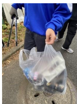
たくさんのゴミが落ちていました