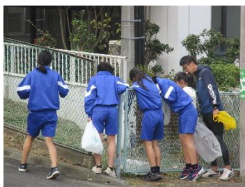
6つのコースに分かれて活動しました