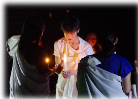
学年で大切にしたい気持ち

A棟3階渡り廊下に、自然教室の壁新聞を掲示してあります。来校の際には、是非ご覧ください。