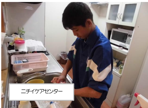
ニチケアセンター