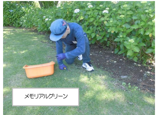
メモリアルグリーン

今回は深谷中学校学区～戸塚駅周辺まで、のべ34の事業所にお世話になりました。ご協力いただいた事業所の皆様にこの場を借りて御礼申し上げます。ありがとうございました。