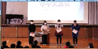
大道小学校での交流会。

2日より、生徒会本部役員がブロック内の小学校を順番で訪ね、来春には後輩となる6年生児童さんに大道中学校の紹介を行いました。10月には小学校児童の皆さんに来校してもらい、授業や部活動の様子を見学してもらっていますが、今回は、新旧生徒会本部役員が、集まった児童さんへスライドや寸劇を使って学校生活の説明をしました。