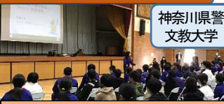
1年 SNSにおける人権講座

大道中では、人権教育を「人が幸せに生きるとはどういうことだろうか」と考える機会と考え、様々な取組を行っています。人権週間には全学年で人権標語や川柳作りに取り組んでいます。生徒個々が自身の想いを文字に表し、今年も素晴らしい作品が提出されています。また、学年ごとにテーマを設け、様々な分野から講演者を招き、「幸せに生きる」について深く考える機会を設けています。