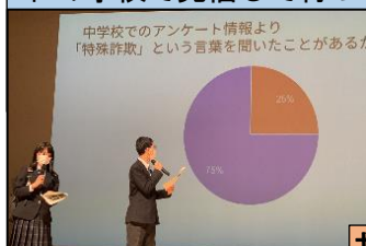
中学校でのアンケート情報より「特殊詐欺」という言葉を聞いたことがあるが

各学校が集まり合同で学ぶ行事があります。金沢公会堂で行われた本サミットとキャンペーン活動もその一つです。サミットには区内の小中学校の代表者、金沢警察署や補導員会が集まり、社会的な課題となっている「特殊詐欺」や「SNS上の誹謗中傷」について、中学校代表2校が発表を行いました。小学校代表からも「いじめのない学校づくり」をテーマに、校内活動の発信がありました。学んだことをそれぞれの学校で発信して行ってほしいと思いました。