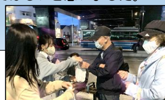
サミット後には八景駅前で補導員会と合同で防犯を呼びかけるキャンペーン活動を行いました。