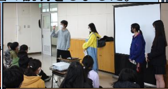
こちらは朝比奈小学校。