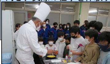
1年生職業講話。調理師さん講話では料理の実演までありました

職業観・勤労働機の向上を目的として、各中学校ではキャリア教育に力を入れています。学校だけでは実感を伴う授業が難しく、様々な協力組織からお力を借りて行っています。大道中でも、1年生には様々な業界から講師をお招きして職業講話を実施、2年生は近隣事業所からのご協力を得て職業体験を行っています。職業体験は実際に生徒が事業所へ出向き、実際の仕事を体験する行事となっています。