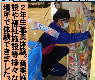
2年生職業体験。商業施設や福祉施設等様々な場所でも体験できました。