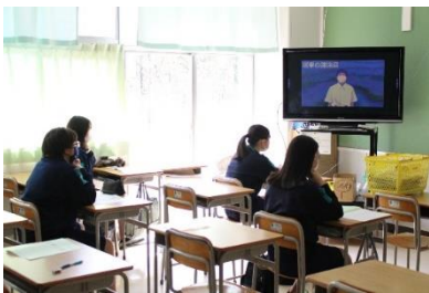
立会演説会のようす