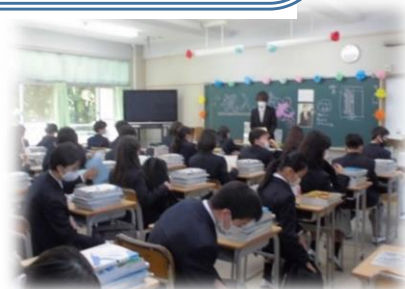
入学式後、初めての学活

「まん延防止等重点措置」が実施されますが、何とか生徒たちの活動が守られるよう、祈るばかりです。