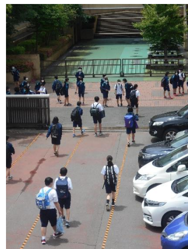
下校時の様子。間隔とれていますか？

は大勢が同空間で仕事をしています。そのため、会議室でも業務ができるようにと、LANを引き、パソコンを置いて第2職員室として活用できるようにしました。特別教室がある先生にはなるべくそこで仕事をしていただき、職員室が混みあっている時は会議室を利用するようにしています。