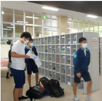
登校時の検温表確認前の様子

3ヶ月に及ぶ臨時休業が終わり、分散登校ではありますが学校がスタートしました。この間、様々な情報が飛び交って、皆さんはさぞかし不安な思いで毎日をおすごしていたのだらうと思います。事実上初めての登校となる1年生、進級した実感もなく、「1年生はこちらから…」などという呼びかけにまだ振り向いてしまう2年生、そして何より、自らの中学3年生のスタートが思いもかけないものになってしまった3年生。皆がどのような顔をして登校して来るのか、本当に不安でした。6月1日、学校職員は皆さんが登校してくるのを校門や教室で緊張しながら待っていました。ですが、学校が再び始まったうれしさか、久しぶりにいつもの半数の人数ではありますが、友人と会えたよるこびなのか、思いのほか表情が明るく、予定の時間を待ち切れなかったかのように登校して来る皆さんの顔をみてちょっとだけホッとしました。