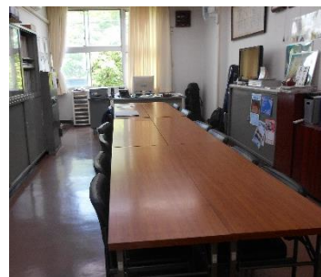
広がった校長室です。

校長室で会議を行う際の三密が気になる…という校長先生の発案で、ソファが出され、長机を増やして会議用のスペースを広くしました。ソファの行き場所を今考慮中です。自販機近くに置いてありますが、そういうわけですのでぜひご容赦ください。