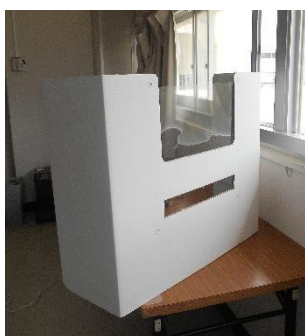
3年の授業でデビュー予定

最近、学校再開ということで、様々なところからお役立ち用具などのちらしやFAXが送られてきます。そんな中で、お試しとして一つ提供するので、使ってみてご検討ください。という