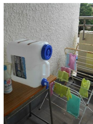
消毒薬のタンク他

保健室も分化されました。職員玄関横の相談室を第2保健室として活用しています。発熱があったり、経過観察を要する場合は第2保健室を使用し、怪我などの一般的な傷病対応は従来の保健室で行います。カウンセラーが来校する金曜日は相談室として使用するため、第2職員室となっている会議室にその機能を移すことになっています。空き教室がほとんどないので、状況に応じた対応をできる範囲で工夫して行っています。