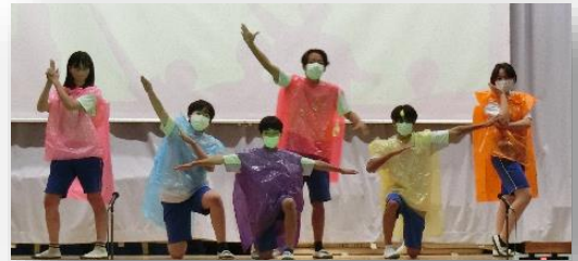
♡マナーを守れるんジャー♡

いくぞ2年生！ 五感で感じる green star 一人一人大切な個性 それを輝かせることだけに 一生懸命になればいい