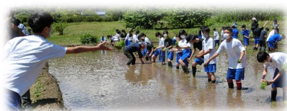
相和小学校の生徒との交流会