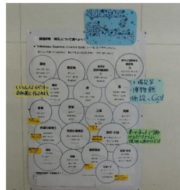
【テーマ決定のヒント】