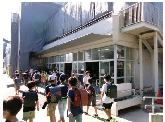
令和5年度 生徒会長から

横浜子ども会議でもありましたが、あいさつを通して人との関わりをつくり、相手のことを理解することができるように、生徒会本部もこれから活動していくので、みなさんもあいさつをしてさわやかに一日をスタートできるようにしていきます。