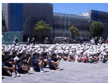
小中合同避難訓練