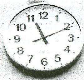
寄贈 秋葉中ファンド