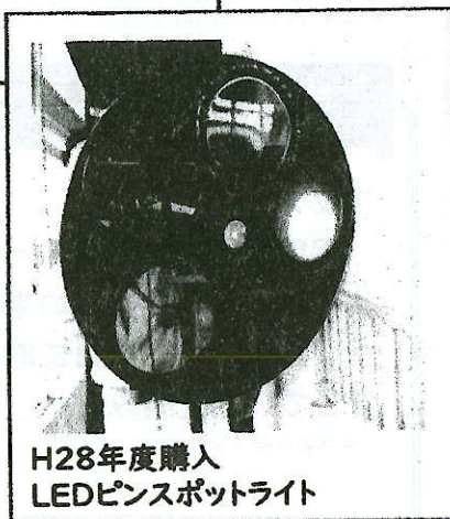
H28年度購入 LEDピンスポットライト