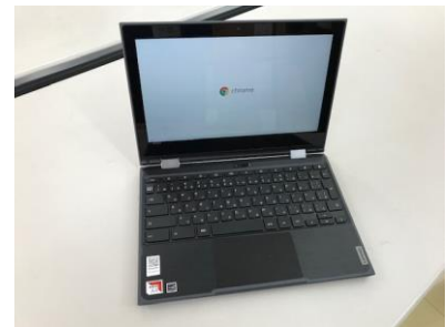
学習用 PC (GIGA 端末)