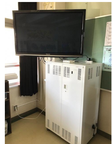
壁掛け TV と充電保管庫