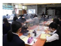
(多摩美術大学講師)