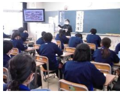
(フォトスタジオライ)