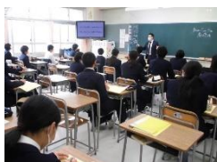
(株式会社 Dreams Come True)