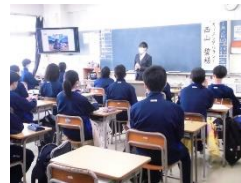
(オリエンタルランド)