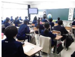
(カフェテーク葉山)

本紙巻頭言にもありますように1月27日(木)にキャリア教育の一環として、1・2年生を対象とした職業講話を実施いたしました。実社会で働く方々の話から勤労の喜びや厳しさを知り、働くことの意義や職業に対する考えを深めたり、自分の生き方を考えるきっかけや指針をつかんだりすることで、生徒たちに望ましい「職業観」や「勤労観」が育まれることをねらいとしています。生徒たちは各分野におけるプロフェッショナルの方々の熱のこもった講話に、真剣に耳を傾けていました。