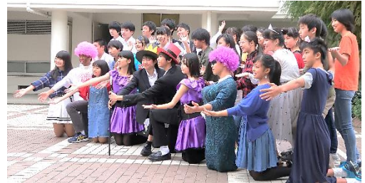
オープニングでのスローガン発表(上) 発表を終えクラスで記念撮影(下)