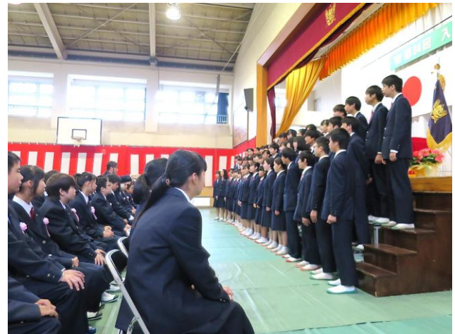
「入学式」合唱隊による校歌紹介と歓迎の歌

このほか、学校・学年だよりやホームページで積極的に情報発信を行い、異校種、地域、諸機関とも連携してきめ細かい指導や支援に努めてまいります。保護者・地域の皆様、引き続きご支援・ご協力をよろしくお願いいたします。