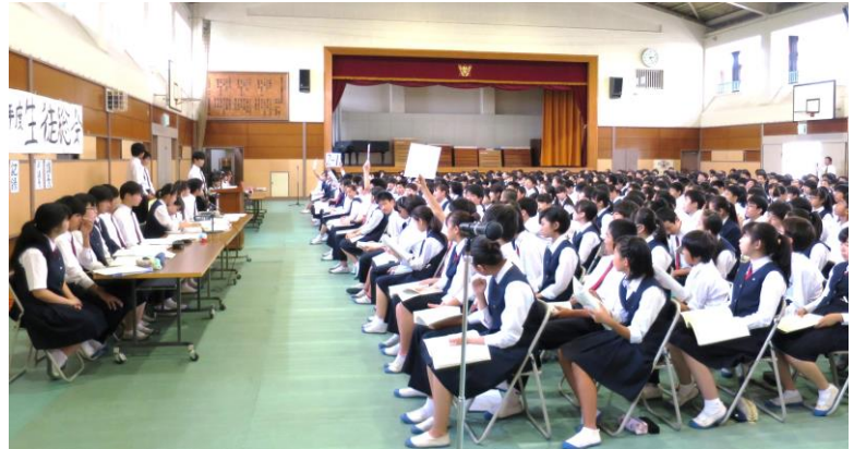
生徒総会の活発な討議の様子

1年横浜校外学習、2年自然教室、3年修学旅行が無事に終わりました。学校を離れ活動することで、教室では学べないたくさんのお話を学び、よい思い出ができたようです。その様子は7月号で詳しくお伝えします。