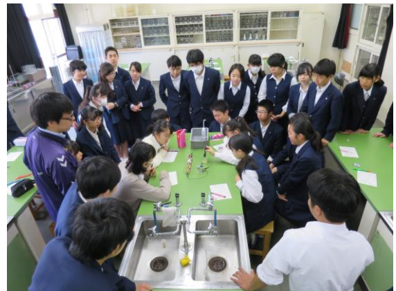
3年理科 水溶液とイオンの実験

生活意識調査では、学年が上がるにつれて、学習意欲、自尊感情、規範意識が高まり、コミュニケーション力がついてきていて大変よいと思います。中学生時代に何事にも自信を持って取り組み、未来を力強く生き抜く力を蓄えてほしいと願っています。