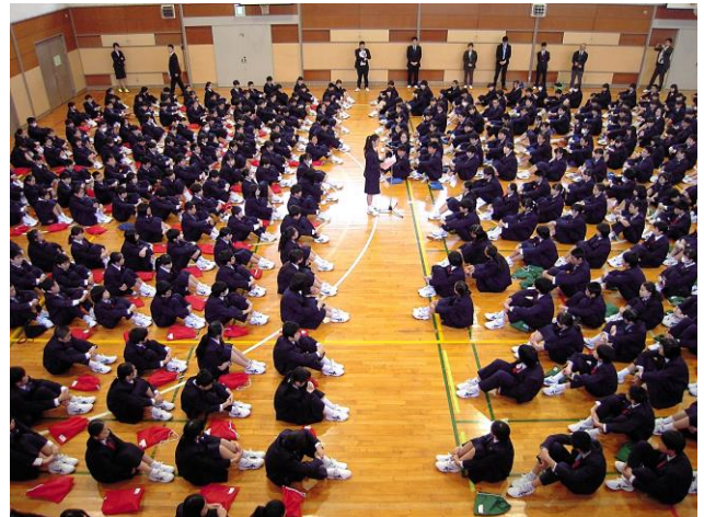
「対面式」新入生を迎え全校生徒がそろいました

昨年度、全校生徒が学習、行事、生徒会活動、部活動…いろいろな場面で頑張った素晴らしい成果を残してくれました。今年度は、それらをさらに発展させてください。生徒が明るく楽しくいきいきと生活できる学校。毎日の活動が充実している学校。朝、登校するのが楽しみな魅力ある学校。全校で力を合わせて、そんな「活気あふれる学校づくり」を進めていきましょう。