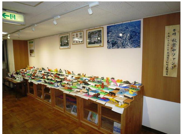
1年美術作品の展示「動物の彫刻」

今年度もあとわずかです。3年生には、直面する壁を乗り越え、希望通りの進路決定をしてほしいと願っています。1, 2年生には、1年間のまとめをしっかりとって、新しい学年に進級して行ってほしいと願っています。まとめの時期、一日一日を大切に過ごし、有終の美を飾ってください。