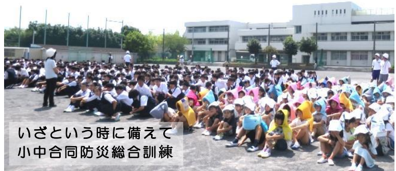
いざという時に備えて 小中合同防災総合訓練

夏休みが終わり、生徒達の元気な声が学校に戻ってきました。全校生徒が大きな事件や事故に巻き込まれることなく、無事に夏休みを過ごせほっとしています。今年の夏、地域のお祭りや行事に初めて参加させて頂きました。地域の皆様の学校や生徒達に対する熱い想いに触れ、感謝の気持ち