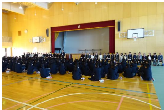
◆ 面接官へのごあいさつ ◆

また、ご多用の中、あかね台中学校にご来校いただきました皆様へ心より感謝申し上げます。今後ともどうぞよろしく宜しくお願いいたします。