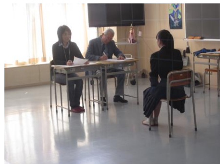
◆ 緊張感が漂います ◆