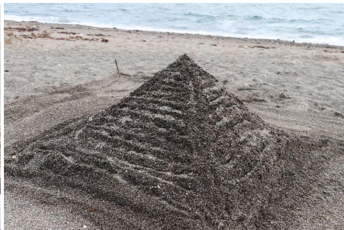
砂浜にて『砂の造形』