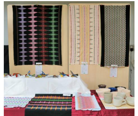
地域交流室 展示作品 〈職場体験・国語科・美術部〉 〈1年美術科 テラコッタ〉 〈8・9組 作品〉