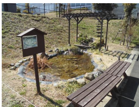
プリムラの泉（ピオトープ）