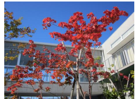
▲ コハウチワカエデ

丹沢の西に、真っ白に雪化粧をした富士山が美しく見えるようになり、冬に入る準備をする頃になったことを実感します。11月も下旬に入り、今年もあと1ヶ月余りとなりました。そして、一年の締めくくりの月「師走」を迎えます。