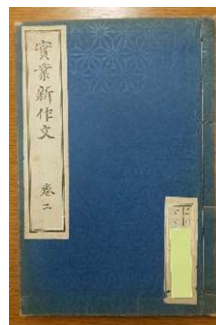
糸で閉じられた和綴りの製本です 例文タイトルは、まさかの「犬の下痢どめの問合はせ」