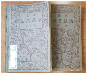
表紙の図柄も美しい、教科書らしからぬ本です

カラーのイラストが美しい製図の教科書「最新圖法教本 第一・二巻」や、手紙の書き方など実際に日々役に立ちそうな「實業新作文」は例文も面白く、当時の授業中にも笑いがあふれていたのではないのでしょうか。