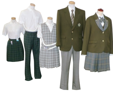
*スラックスの柄はもう1種類選べます。男女ともに選択できます。