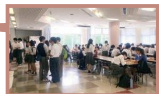
食堂（コムニホール）