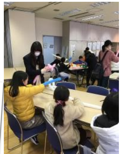
女子チームは器用で、初めてとは思えないぐらいのみこみがよかったです。