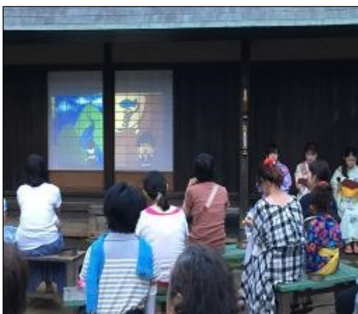
1部は18:30からでしたが、影絵はよく見えました。19:20からの2部はより幻想的な雰囲気でした。