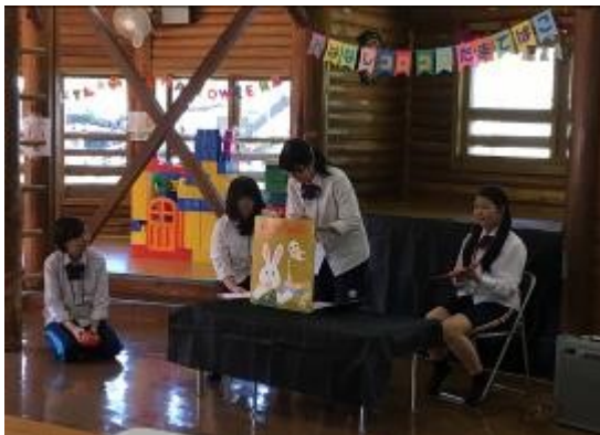
「おばけの天ぷら」の読み聞かせとクイズ

6月に続き境之谷ログハウスのイベントを10月5日に行いました。1年生2名、2年生5名の総勢7名の部員でハロウィンイベントを開催しました。ハロウィンにちなんで読み聞かせは「おばけの天ぷら」、工作はミニお菓子バケツづくりを企画しました。天気が良すぎて、また近隣の幼稚園の運動会と重なったため、6月ほどの参加者はありませんでしたが、「ありがとう」の声をたくさんいただきました。今回の反省は2020年に活かしていきます。