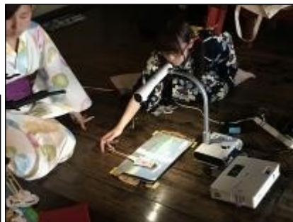
舞台裏はこんな感じです。