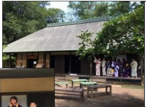
古民家見学もできます。