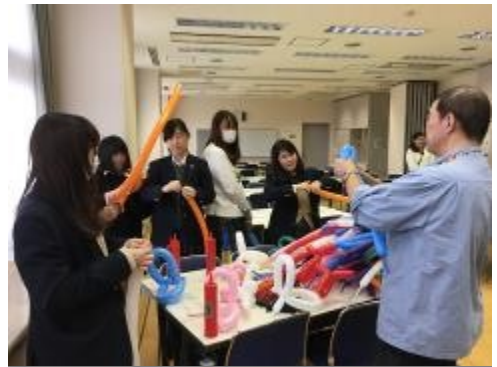
部員は先生に新しい作品の作り方を教わりました。