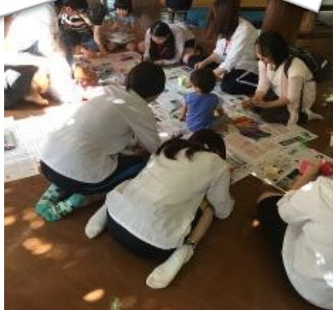
折り紙に絵をかいて、コップに貼ったらお菓子バケツの出来上がりです！

爆弾落としゲームは、「パブリカ」に合わせ、音楽が止まった時にカボチャを持っていた人が質問に答えます。