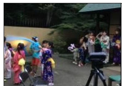
クイズの景品はバルーンアート。