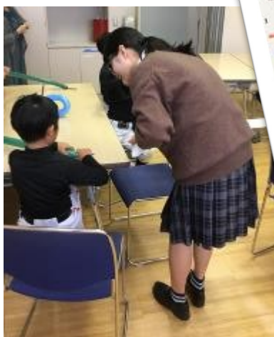
多くの野球少年が参加していました。元気いっぱい。