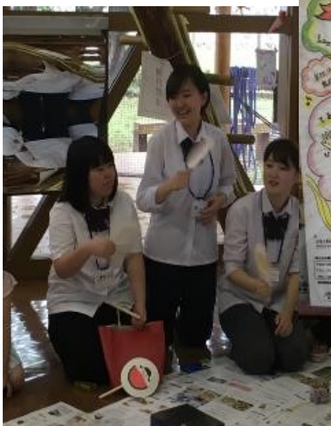
紙皿を使ったうちわづくりを行いました。2枚の紙皿に絵を描き、割り箸を付ければ即席うちわの出来上がりです。