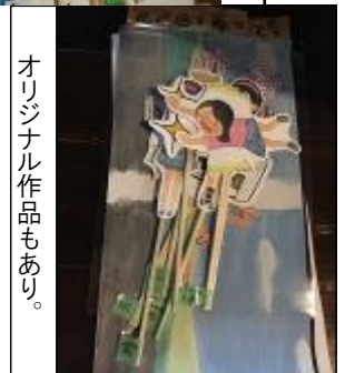
オリジナル作品もあり。