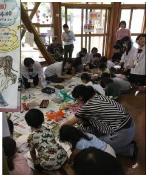
多くのお子さんに参加していただき、会は大盛況でした。