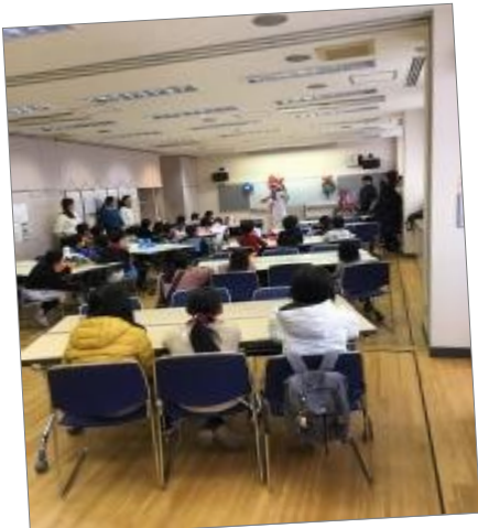
先生の説明を聞いて、みんなでイヌと剣を作りました。

山手にある竹之丸地区センターで行われた地域のクリスマス会で、バルーンアート教室のお手伝いをしました。今年で7年目の活動です。元気な小学生相手に圧倒される場面もありましたが、バルーンが完成したときの笑顔に癒されました。バルーンアートの先生に新作を教わったり、サンタさんからお菓子をいただいたり、部員にとっても楽しいクリスマス会になりました。