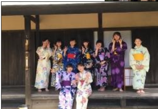
部員は浴衣に着替えてお祭り気分を演出します。