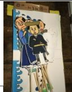
すべて手作りです。