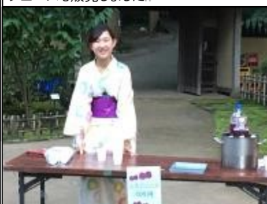
古民家スタッフの方特製の美味しい紫蘇ジュースも販売しました。