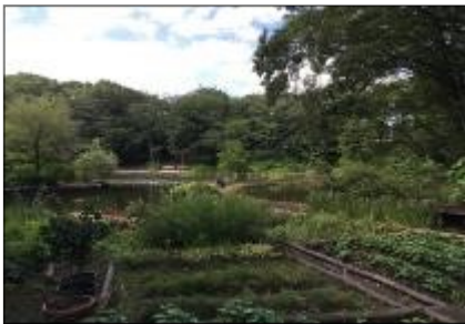
せせらぎ公園は、とても素敵な公園です。

7月27日(土)仲町台の駅から徒歩5分にあるせせらぎ公園内の古民家にて影絵ばなしのイベントを開催しました。町のお祭りに合わせたイベントで、一時はイベント自体の実施も危ぶまれましたが、このイベントを機に引退する3年生の熱意が通じたのか、当日は台風もそれ、多くの方に見ていただくことができました。来年の実施に向け1、2年生は意欲を見せています。ご期待！