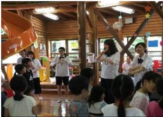
「糸まきまき」の手遊びで会をスタート。

恒例の境之谷ログハウスのイベントを6月30日に行いました。1年生3名、2年生5名、3年生2名の総勢10名の部員で企画を考え、1時間のイベントを成功させることができました。読み聞かせとクイズ、バルーンアートのプレゼント、うちわづくりと、どの企画にも多くのお子さんが参加してくれて、「ありがとう」の声をたくさんいただきました。次は10月頃の予定です。