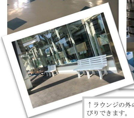
↑ラウンジの外のベンチでものんびりできます。