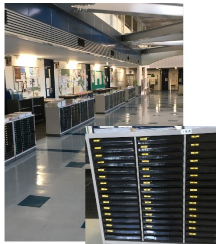
↑全校生徒分のトレーです。授業の連絡などに使っています。