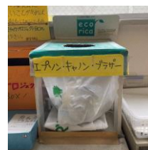
リサイクルボックス