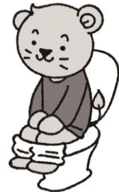
き じかん はいべん 決まった時間に排便