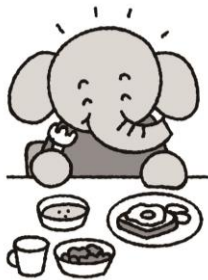
ちようしよく た しっかり朝食を食べよう

新学期がはじまって1か月がたちました。新しいクラスにも少しずつなれてきたころではないでしょうか？5月は今まで緊張していたぶんの疲れが出て、けがをしたり、体調をくずしたりしやすい時期です。学校で元気にすごせるよう、規則正しい生活を心がけましょう。