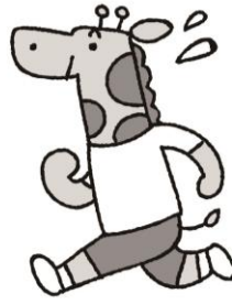
うんどう かな 運動で体をうごかそう