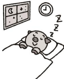
はやあ はや お じゆうぶん すいみん 早寝早起きで十分な睡眠