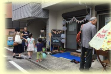
9/21 プレオープンの様子